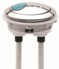
A3617 φ 58mm