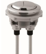
A361012 φ 48mm