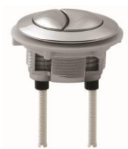
A36021 φ 38mm